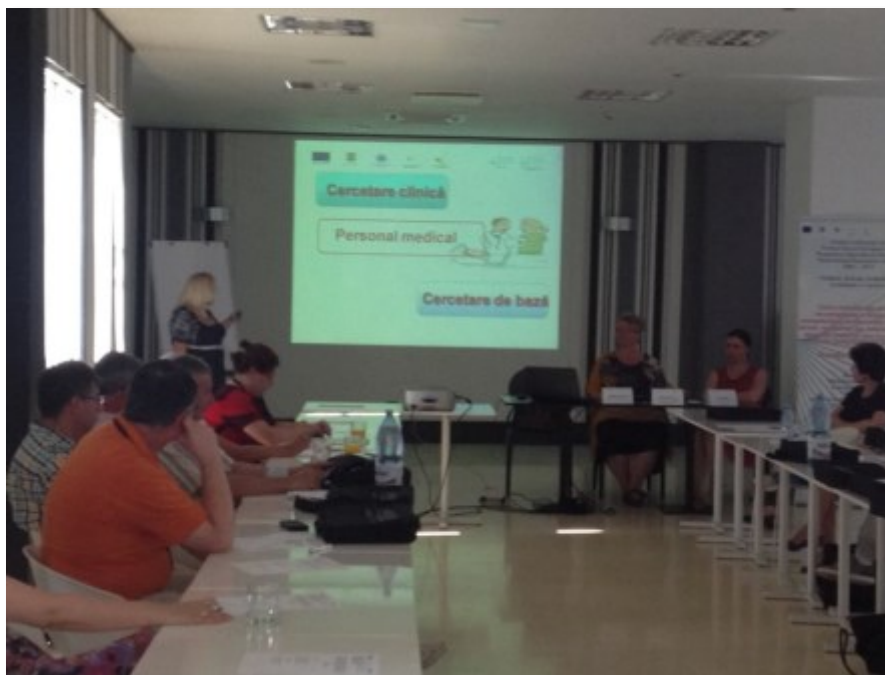
Seminar pregătire aplicată—Hotel Paradis, Cluj-Napoca

referitoare la acest eveniment puteți găsi la următoarea adresă: www.echivalarestudiiassistenti.ro .