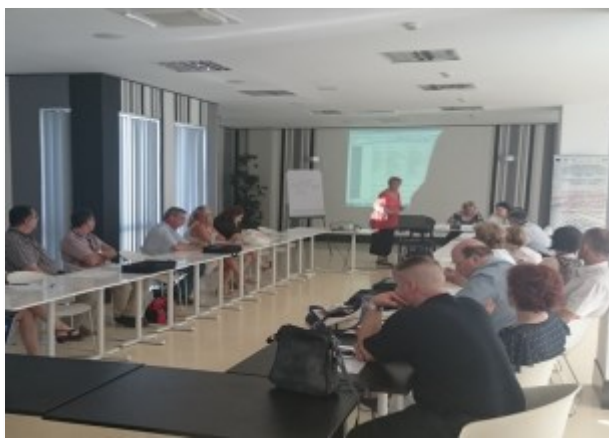
Seminar pregătire aplicată—Hotel Paradis, Cluj- Napoca

- A6-Activități de management de proiect.